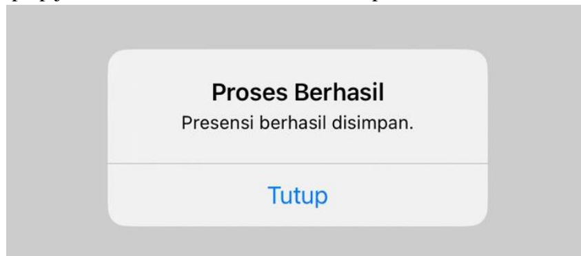
Gambar 18. Tampilan pop up berhasil melakukan checkpoint