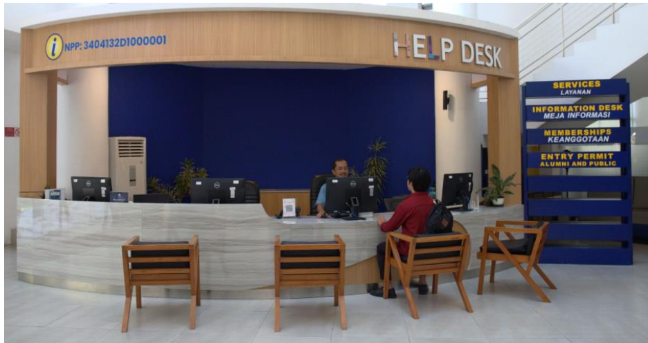
Gambar 19. Layanan Information Desk di Lobby Perpustakaan dan Arsip UGM