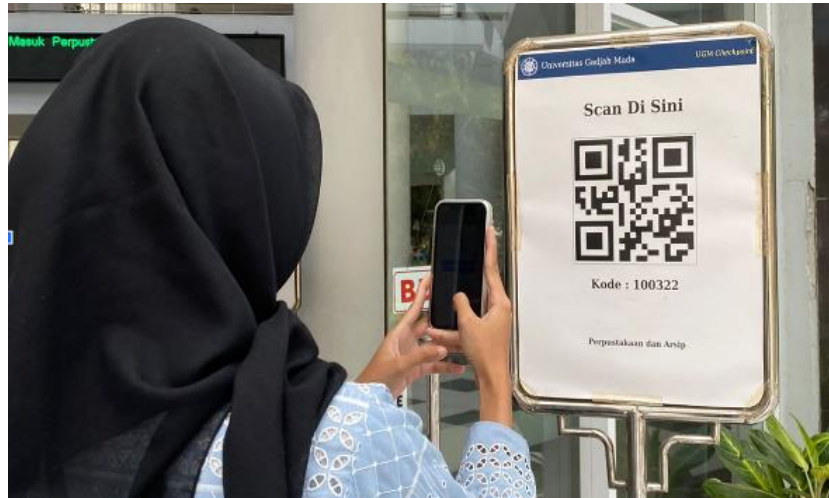
Gambar 16. Scan QR di lobby Perpustakaan dan Arsip UGM