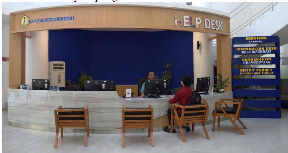
Gambar 2. Layanan Information Desk di Lobby Perpustakaan dan Arsip UGM