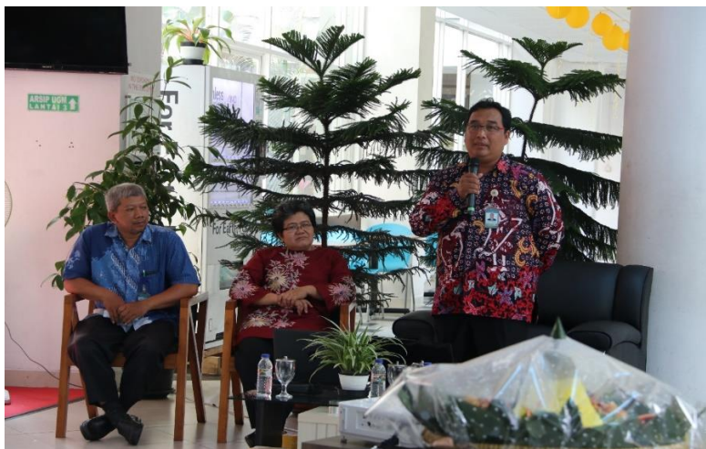
Foto kegiatan Sarasehan HUT Perpustakaan UGM ke-68, 1 Maret 2019