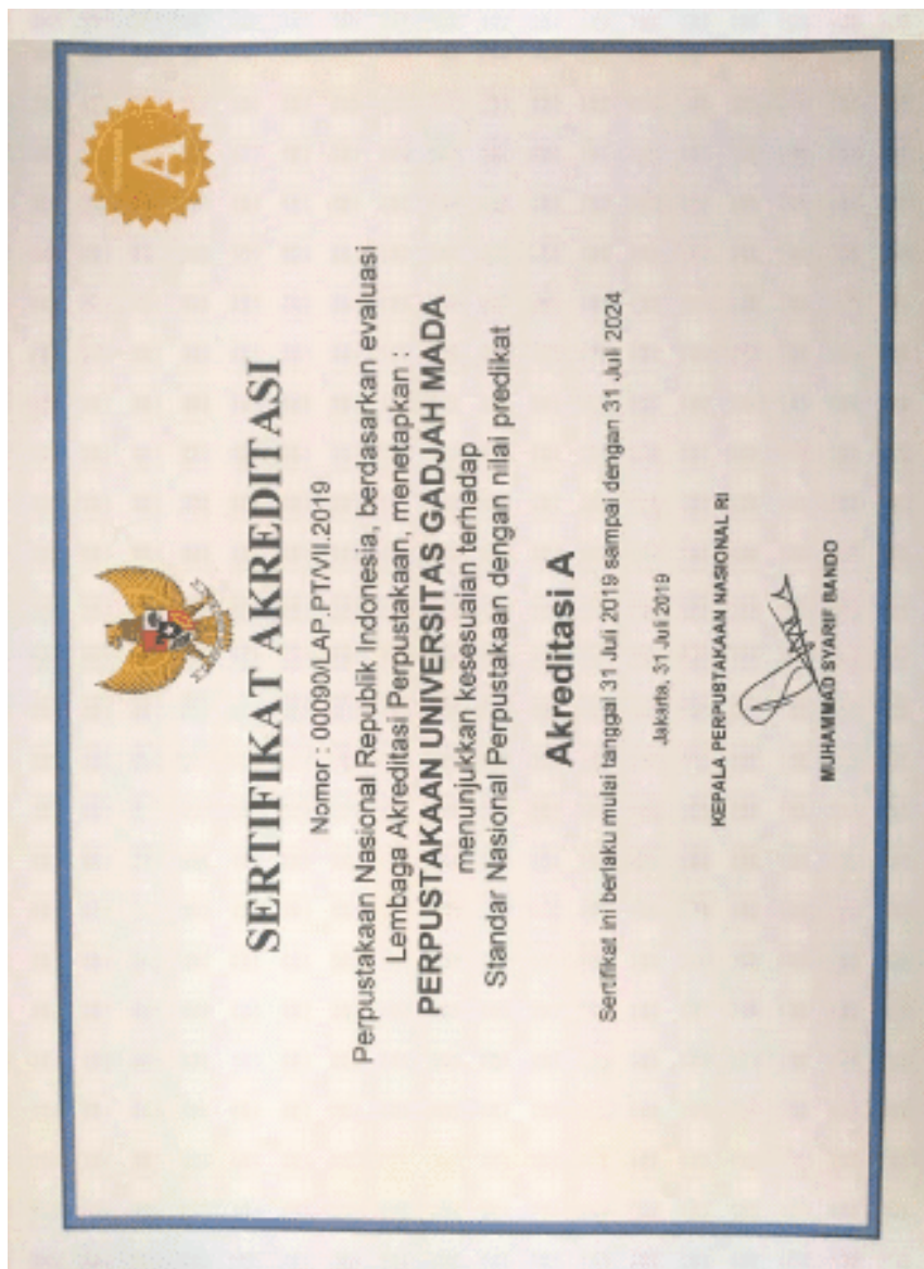
Lampiran 27 Salinan Sertifikat “Terakreditasi A” Perpustakaan UGM Tahun 2019-2024