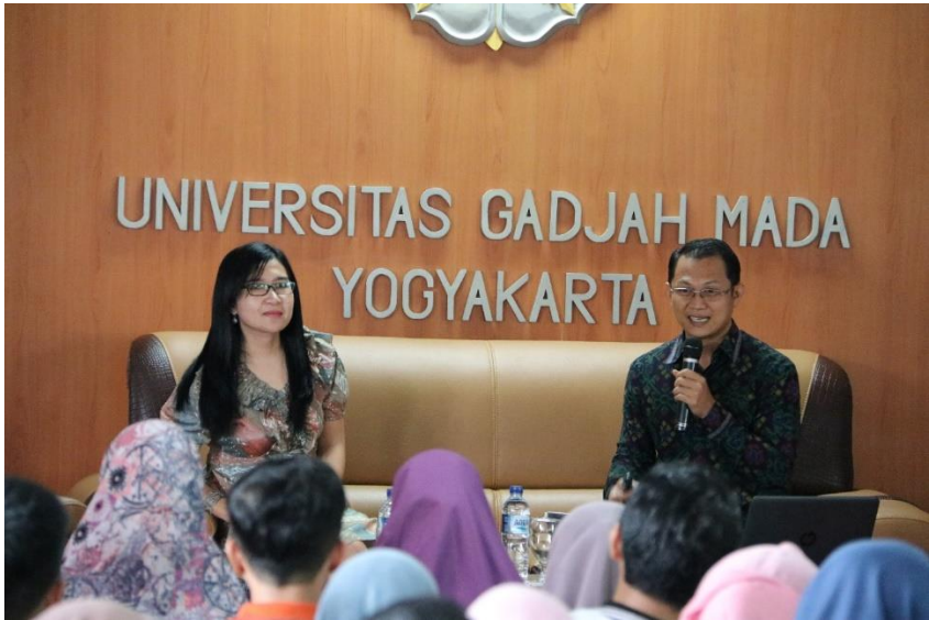
Foto kegiatan Family Gathering Keluarga Besar Pegawai Perpustakaan, 24 Maret 2019