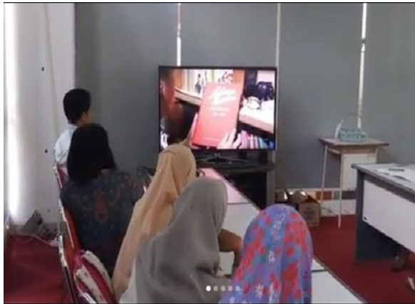
Foto kegiatan Pemutaran Film Sardjito dalam Lukisan Revolusi, kerjasama Perpustakaan dengan Kantor Arsip UGM, 16 Agustus 2018