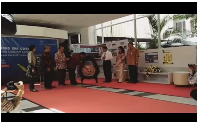
Foto kegiatan Launching SNI Corner UGM di Perpustakaan bekerjasama dengan Badan Standardisasi Nasional (BSN), 3 Juli 2018