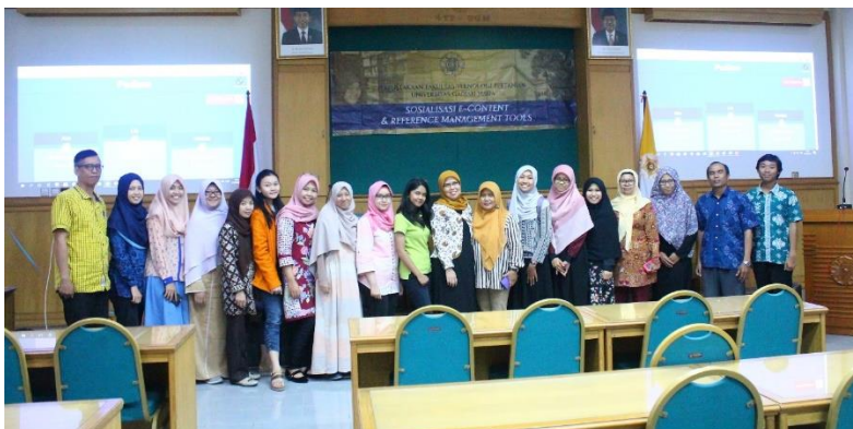
Foto kegiatan roadshow sosialisasi e-contents dan Reference Management Tools di Fakultas Pertanian UGM, 20 September 2018