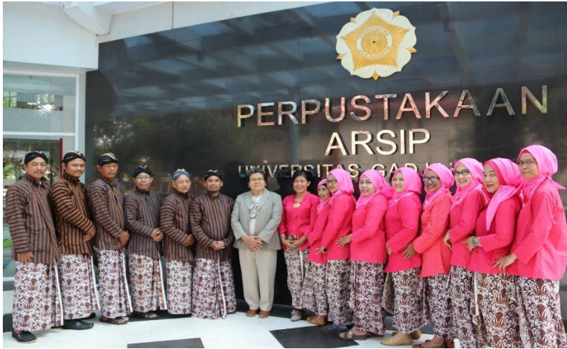
Foto Tim Karawitan Perpustakaan UGM, diambil sebelum shooting tampil live di Gedung PKKH UGM