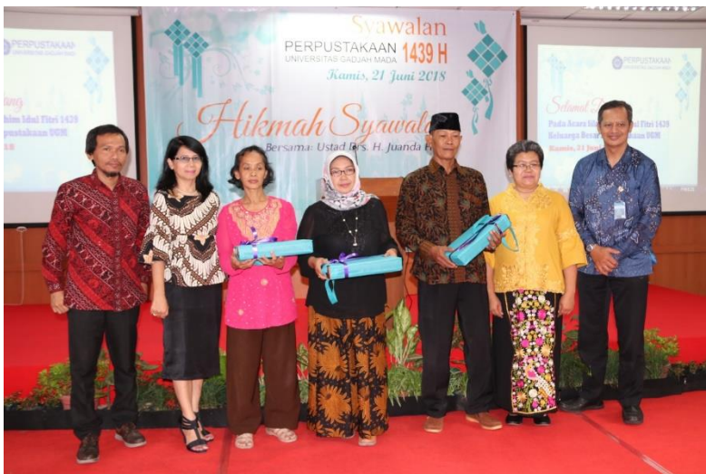
Foto pemberian cinderamata kepada pegawai purnakarya di acara Syawalan Pegawai Perpustakaan UGM, 21 Juni 2018