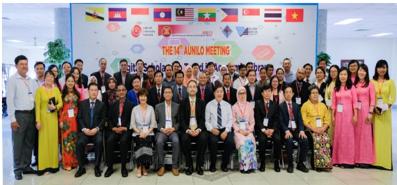
Foto kepesertaan Perpustakaan UGM dalam the 14 th AUN/ILLO Meeting dengan tema “Digital Scholarship Trend in Academic Library” di Can Tho University, Viet Nam tanggal 2-4 Juli 2018