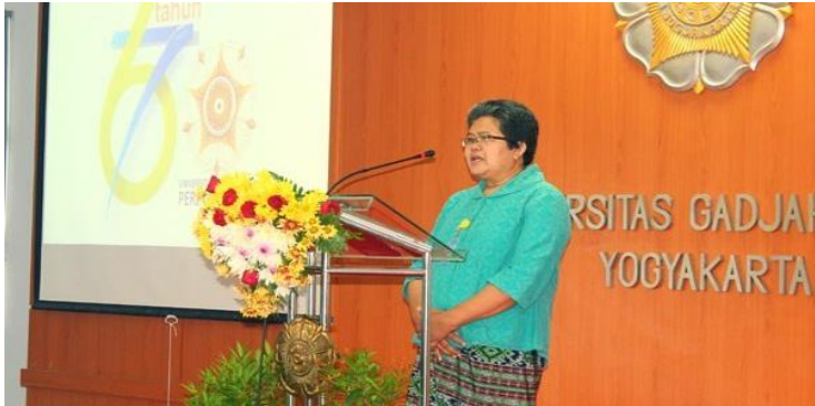
Foto kegiatan penyampaian Laporan Perpustakaan Tahun 2017 pada acara puncak peringatan HUT Perpustakaan UGM, 1 Maret 2018