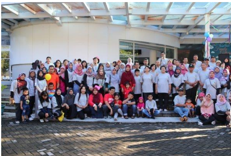
Foto kegiatan Family Gathering dalam rangka HUT Perpustakaan ke-67, tanggal 25 Februari 2018